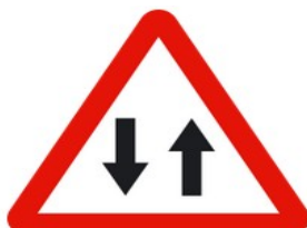
Imagen en Wikimedia Commons de Benedicto 16 bajo Dominio público