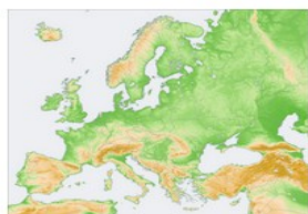
Imagen en Wikimedia Commons de San Jose bajo CC

A continuación puedes ver más formas de comunicación no verbal que utilizan elementos diferentes.